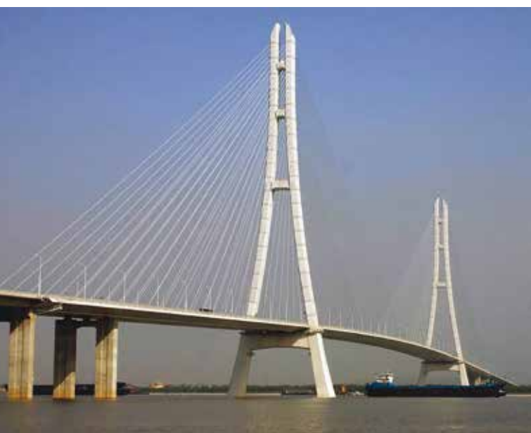
4. Il Third Nanjing Yangtze River Bridge a Nanjing

Il terzo ponte Nanjing Yangtze è il primo del suo genere a Nanchino e uno dei più lunghi ponti strallati al mondo. Il progetto da 490 milioni di Dollari comprende due torri alte 215 m; il ponte è lungo 1.288 m, largo 37,5 m e la campata più lunga misura 648 m; accoglie la G42 Shanghai-Chengdu Expressway e la G2501 Nanjing Ring Expressway. Il sistema Penetron® è stato utilizzato per trattare i pilastri in calcestruzzo e il piano in calcestruzzo del ponte per garantire una struttura resistente e impermeabile (Figura 4).