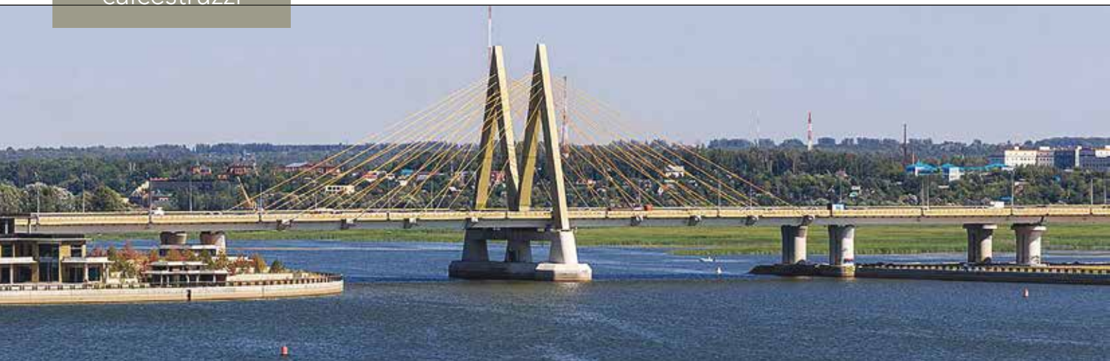
3. Il Millennium Cable Bridge a Kazan