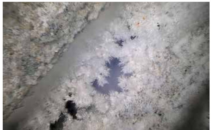
1. La crescita cristallina in una fessura di calcestruzzo al microscopio

Un'indagine condotta nel 2007 nell'ambito del progetto CONREP-NET [1] ha mostrato, inoltre, che il 50% delle strutture in calcestruzzo riparate è destinato a danneggiarsi ancora, il 25% delle quali nei primi cinque anni, il 75% entro dieci anni e il 95% entro 25 anni. Questo è solo un esempio dell'urgente bisogno di un profondo ripensamento dei concetti e dei processi di progettazione per strutture nuove e riparate in ambienti aggressivi