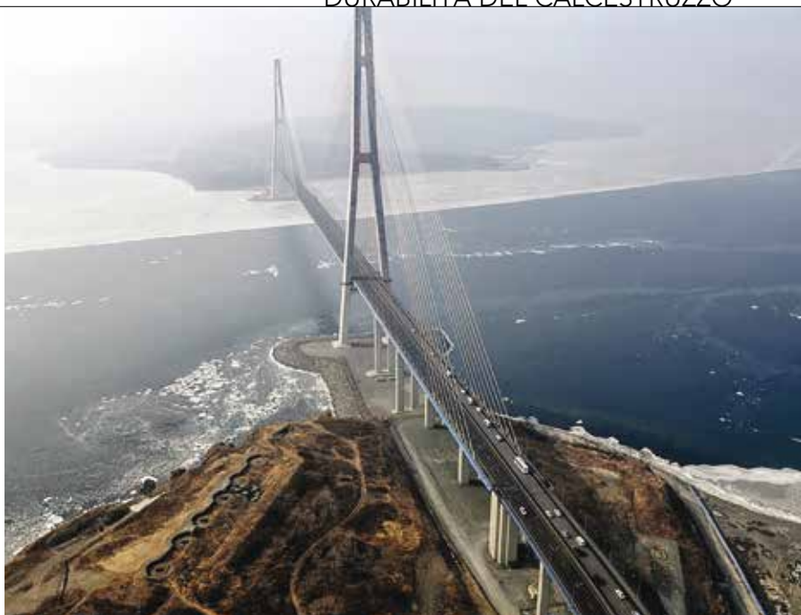
2. Il Russky Island Bridge a Vladivostok

Il sistema Penetron® è una tecnologia "integrale": interessa infatti l'intero spessore del manufatto, "attiva nel tempo", ogni qualvolta vi siano condizioni di umidità, economica e flessibile, che velocizza le operazioni di posa e assicura la durabilità dell'opera nella vita di esercizio. Quando i prodotti del sistema Penetron® vengono applicati ad un calcestruzzo umido o bagna-